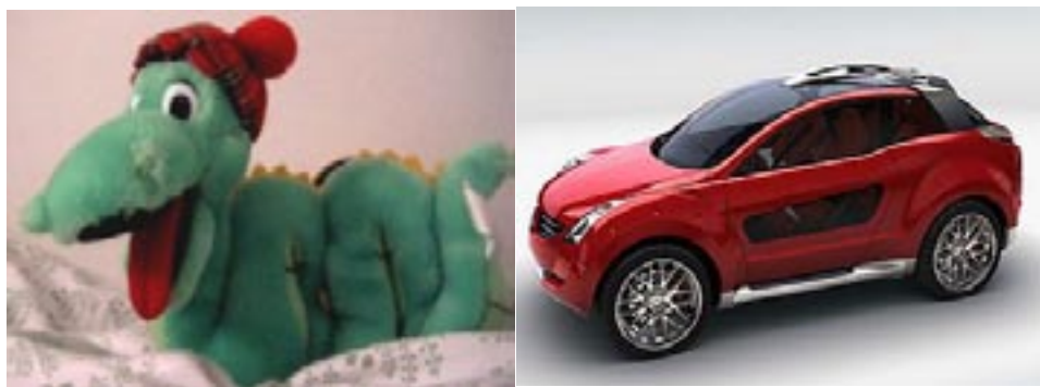
Dvakrát komerční inspirace lochnesskou: český plyšák zvaný Lochnesska (jak jinak, že ano?) a japonské třídvéřové kupé Mitsubishi Nessie. TOMÁŠ KOMÍNEK (oktáva)