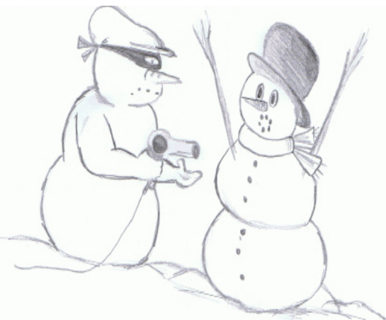
Kresba: NELA FEJTOVÁ