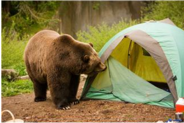
im Zelt übernachten